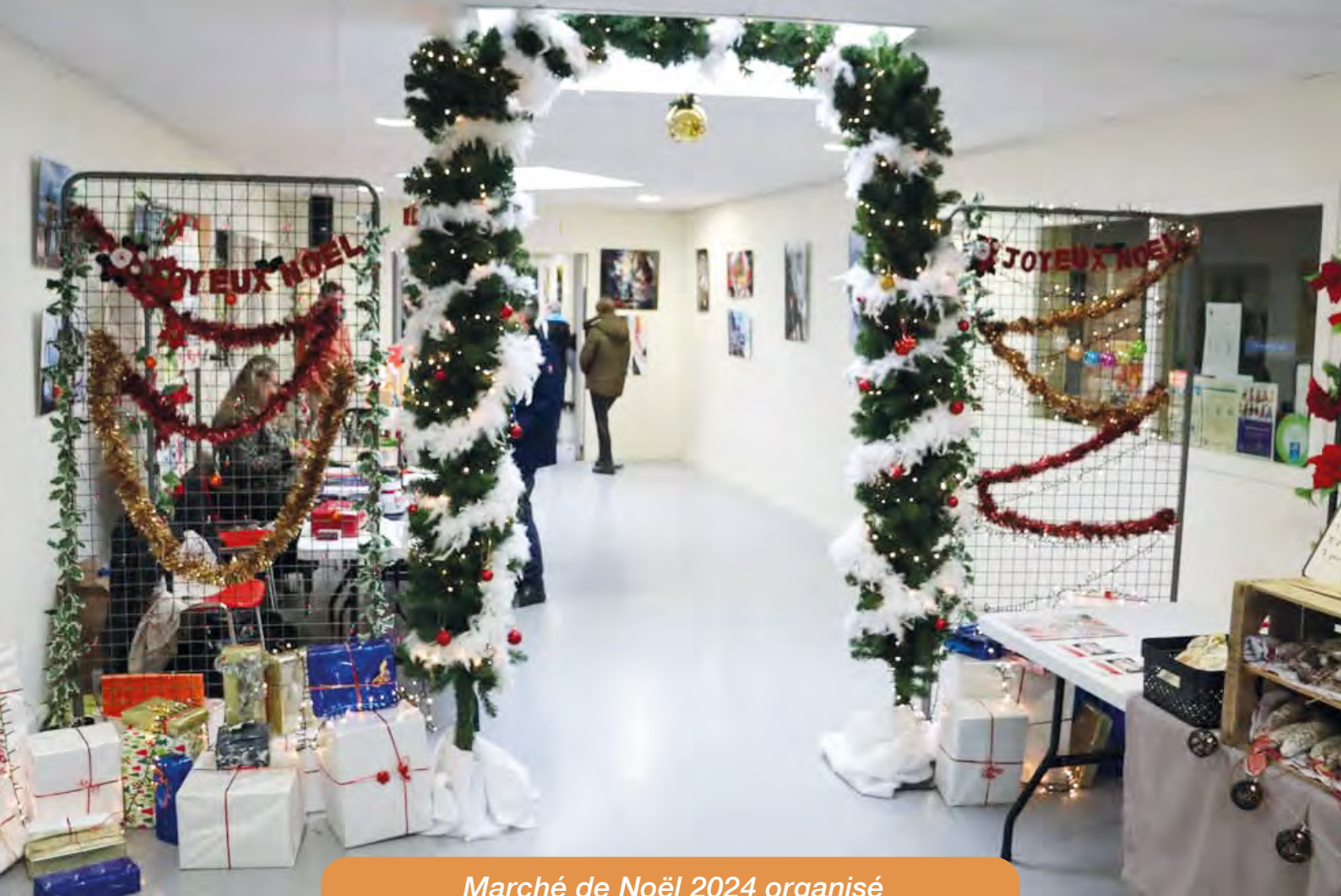
Marché de Noël 2024 organisé avec le Comité des fêtes.