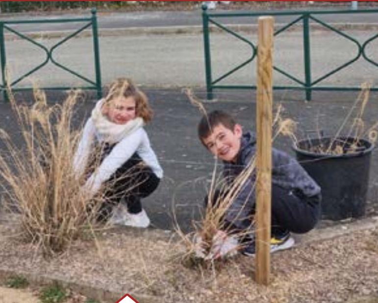
Plantation de végétaux par les membres du Conseil municipal jeunes (CMJ) dans les parterres situés près du Collège Pierre Belon. Une action engagée avec les précédents élus du CMJ.