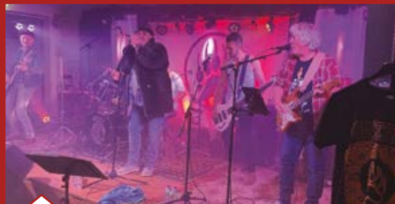
Concert de rock vintage avec le groupe manceau Grizzly : un sympathique retour vers le le rock'n'roll des années 70.