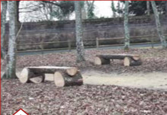
Installation de bancs par les services techniques municipaux dans le bois de la Garenne.