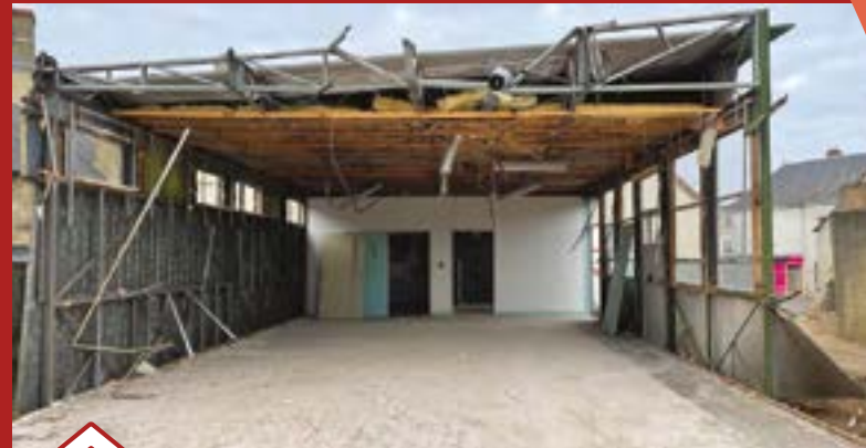
Destruction de l'ancienne salle de danse où se déroulait autrefois le repas des anciens.