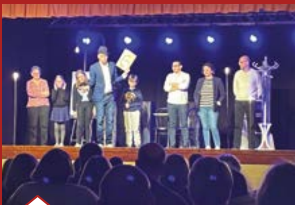
110 personnes assistent au spectacle hors du commun du mentaliste Mathieu Chesneau qui bluffe son public.